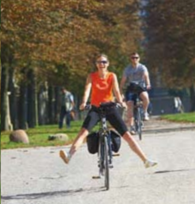
DIE SCHÖNSTEN RADTOUREN