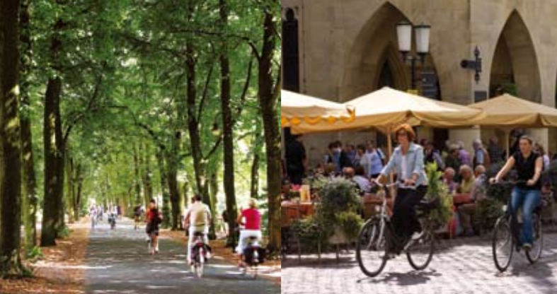
RADFAHREN IN UND UM MÜNSTER