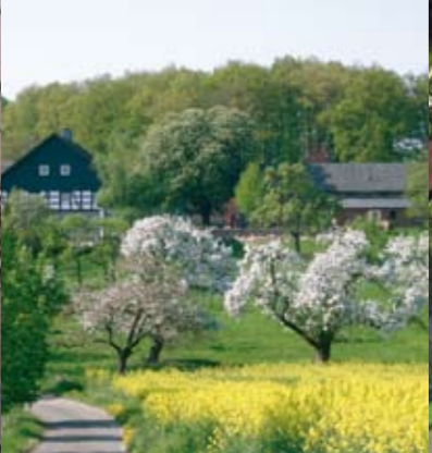
DIE SCHÖNSTEN RADTOUREN