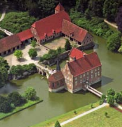
DIE SCHÖNSTEN RADTOUREN