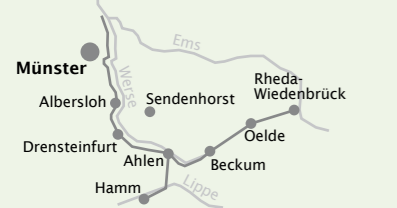
Karten erhalten Sie in der Münster Information.

Der Werse Rad Weg verläuft auf 117 km durch den südlichen Kreis Warendorf, mal direkt entlang der Werse , mal weiter abseits durch die von der Werse geprägte Landschaft. Einheitliche Ausstattungselemente kennzeichnen den Weg: Aussichtstürme ermöglichen besondere Einblicke in die Landschaft, 34 Infoblöcke präsentieren zahlreiche kulturelle und landschaftliche Besonderheiten, Stelen schaffen Aufmerksamkeit und Orientierung, zahlreiche Rastplätze, gemütliche Restaurants und Landcafés laden zum Verweilen und zur Einkehr ein. Weitere Infos finden Sie im Internet: www.werseradweg.de