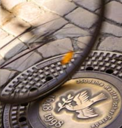
DIE SCHÖNSTEN RADTOUREN