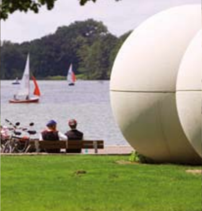
DIE SCHÖNSTEN RADTOUREN